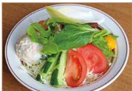
コンビネーションサラダ