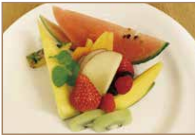
季節のフルーツ盛合せ