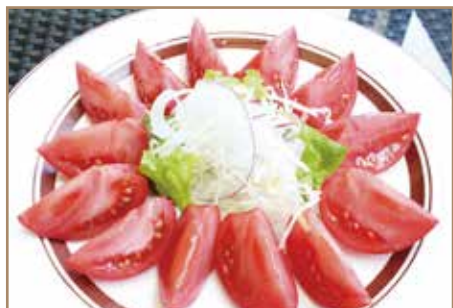
フルーツマトのサラダ