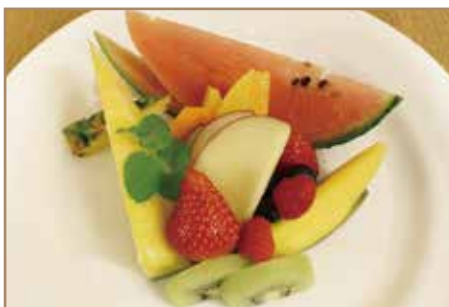
季節のフルーツ盛り合わせ