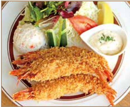
有頭エビフライ サラダ添え