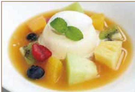
蛸の里特製ババロアフルーツ添え