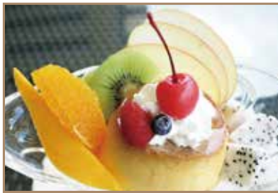
小谷流プリンアラモード