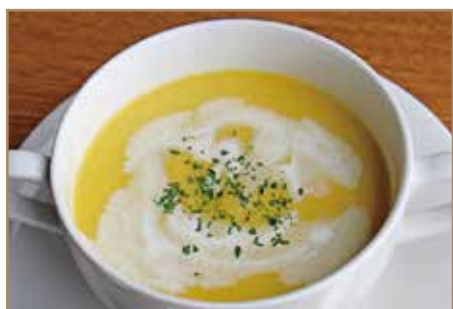
本日のスープ ※内容はスタッフにお申し付けください