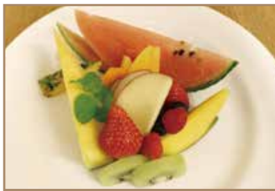
季節のフルーツ盛合せ