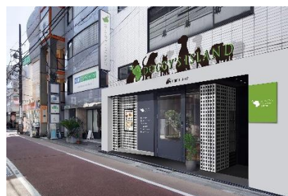
（外観イメージ／左から渋谷松濤・松陰神社前・学芸大学）