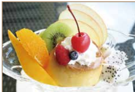
蛸の里特製プリンアラモード