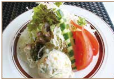
小谷流のグリーンサラダ 新鮮野菜を使用した1人前のサラダ盛合せ ¥880