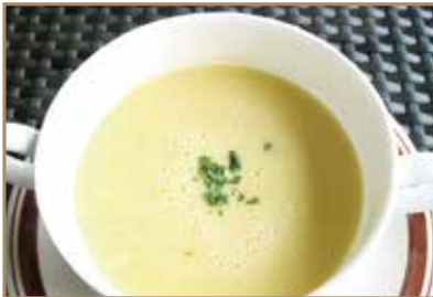
コーンポタージュスープ 味わいをお楽しみください。 ¥550