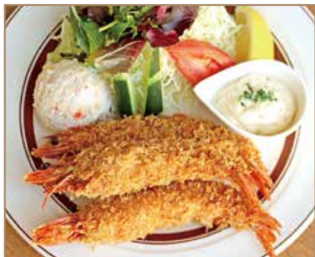
有頭エビフライ サラダ添え