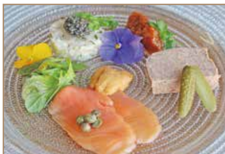
オードブル盛り合わせ