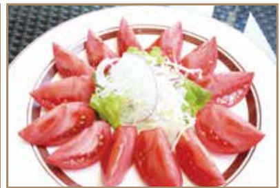
フルーツマトのサラダ 水分制限された高糖度のトマト ¥1,220