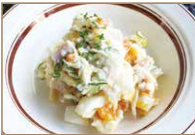
ポテトサラダ 洋食屋さんの手作り ¥660