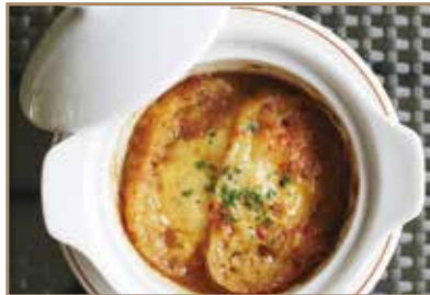
オニオングラタンスープ じっくり炒めた玉ねぎとコクのある コンソメスープをあわせた一品。 ¥1,100