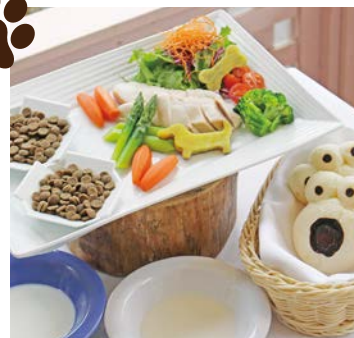
わんちゃんメニューイメージ

※オフ会プランのご予約は、10名様～20名様まで。5日前までのご予約が必要です。 ※プラン実施時間は11:00～16:00(14:00最終受付)、ご利用は2時間までとさせていただきます。 ※天候などにより、ご利用をお断りさせていただく場合がございます。 ※ドッグランご利用の際は、別途料金が発生いたします。詳しくはHPをご覧ください。