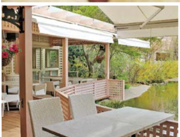
テラス席を一部貸し切り

平日の昼下がりに 小谷流ベーカリー&カフェの 開放的なテラス席で 愛犬と一緒に優雅な時間を お過ごしください